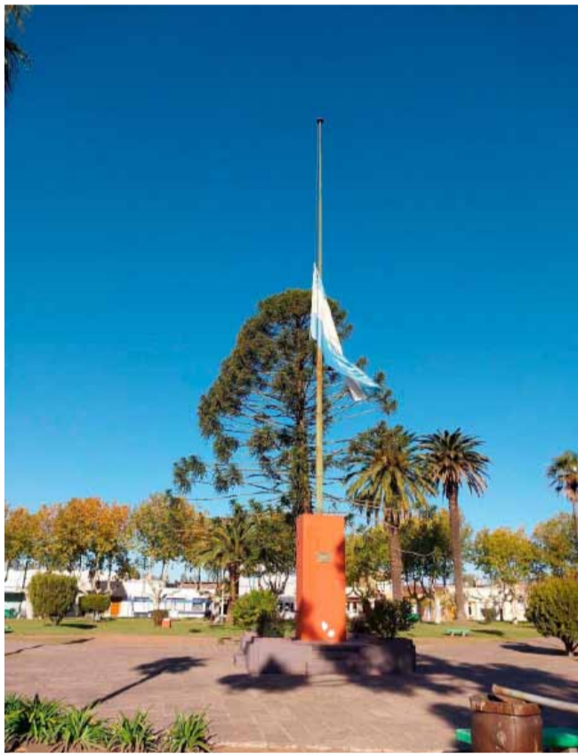
de la comunidad.