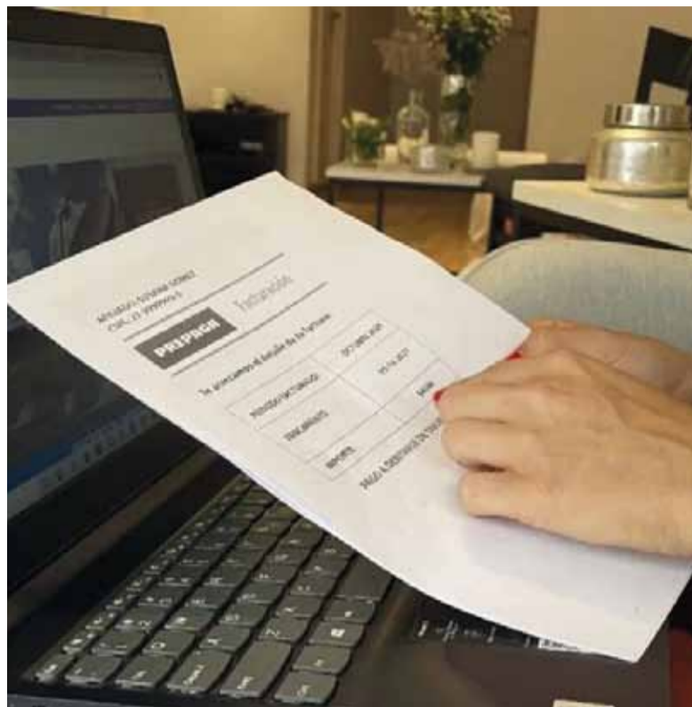
Novedades sobre Ganancias. ARCA prorrogó el vencimiento hasta fines de julio

Entre las consideraciones para decidir la prórroga, ARCA mencionó que "diversas entidades representativas de los profesionales en ciencias económicas han planteado la necesidad de contar con un plazo adicional para la correcta y completa confección de las referidas declaraciones juradas".