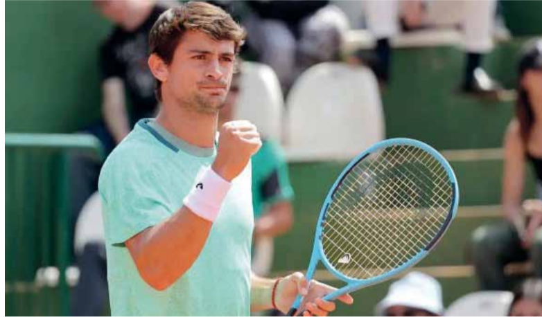
Carácter. El bonaerense y una nueva demostración de personalidad.

En la segunda manga, el bonaerense mostró su versión más sólida. Aunque el inicio volvió a ofrecer intercambios de quiebres, Navone fue asentándose progresivamente y