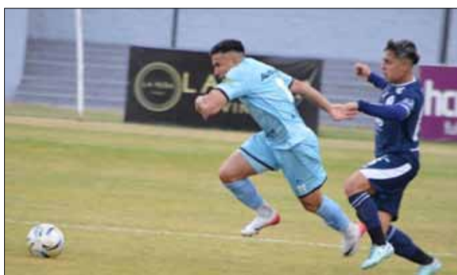
El Celeste viene de ganarle 1 a 0 a Acassuso.

El conjunto que hace las veces de local llega a este compromiso después de igualar en su última pre-