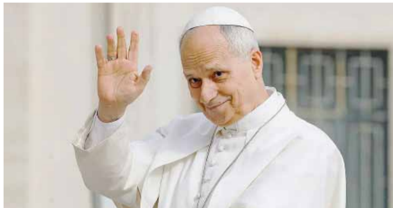
¿Viene? Su Santidad, el papa León XIV.

La gestión diplomática de Argentina para concretar el viaje se remontaría al menos a febrero de este año, cuando Quirno viajó a Roma y entregó en mano al Papa una carta