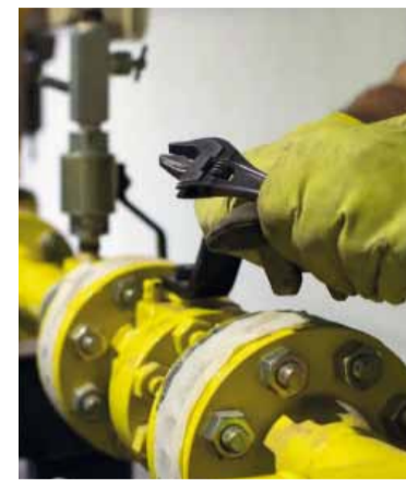
Ola polar. Provoca falta de gas en empresas.

Casi 150 empresas se quedaron sin suministro. Las distribuidoras cortaron el servicio a unas 130 fábricas de Córdoba y estaciones de servicio