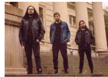
Los miembros de Inacayal.

En medio de la difícil situación que atraviesa el país y con la llegada del frío más intenso del invierno, un grupo de bandas de música realizarán una jornada solidaria en La Plata para juntar ropa y alimentos para la gente más necesitada.