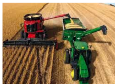
Cosecha récord. Los 6 cultivos principales sumaron 163 millones de toneladas

27,9 millones de toneladas, alcanzando también un máximo de la serie histórica.