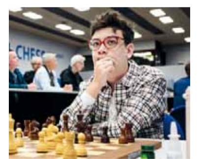
Élite. Oro, entre gigantes.

Además, el torneo repartirá una bolsa total de 500 mil euros en premios. La modalidad de rápidas se jugará entre el 17 y el 19 de junio bajo un sistema de 12 rondas, mientras que el Blitz se