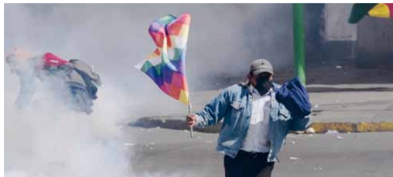
Cerca del estallido. Se agrava la situación en Bolivia.

Miles de manifestantes convergieron desde distintos puntos hacia el centro político de La Paz, colapsando avenidas y parali-