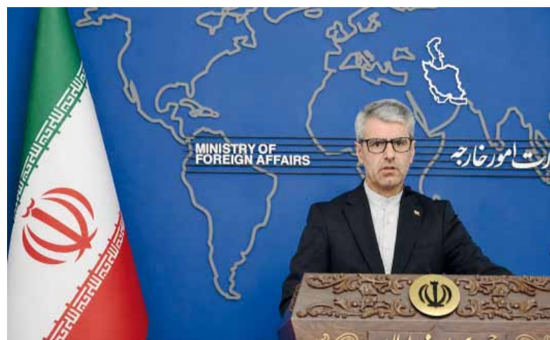
Esmail Baghaei. Portavoz del Ministerio de Relaciones Exteriores iraní.

Baghaei enfatizó que las conversaciones tienen como objetivo poner fin a las hostilidades en todos los frentes, incluido el Líbano.